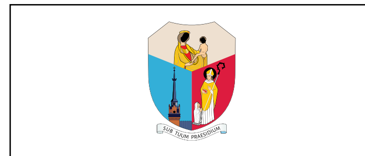
wypełnienie kolorem spoza palety