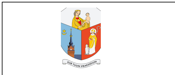
brak pola ochronnego/ maska