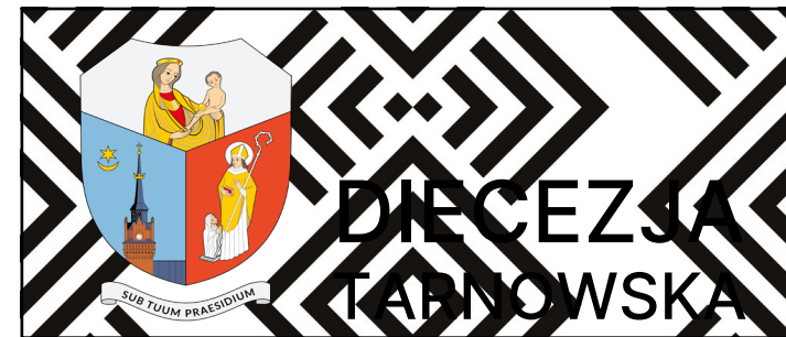
zaburzający czytelność wzór w tle