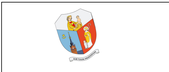
zmiana kąta nachylenia